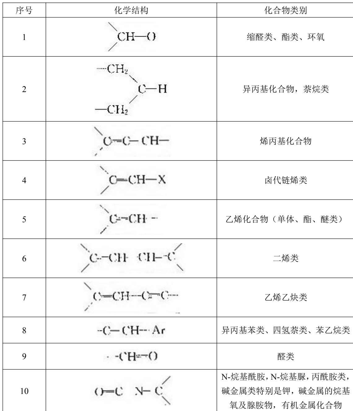
表 3-2 空气中易形成过氧化物的结构